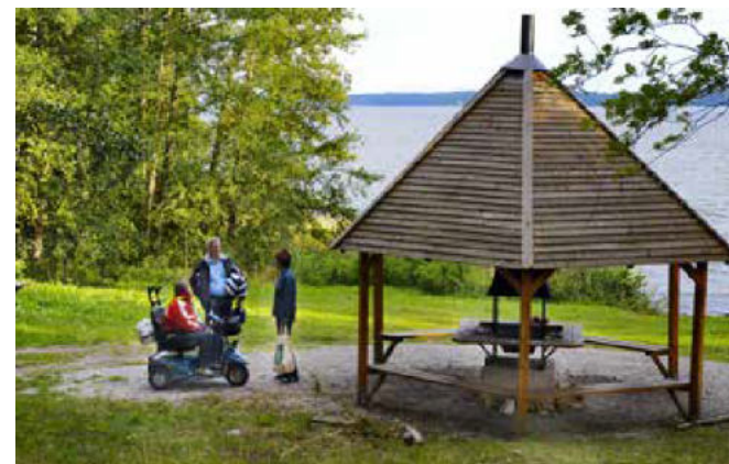
Grillhuset i naturreservatet Frölunda

Vid Frölunda 8 finns ett tillgänglighetsanpassat grillhus och två grillplatser. Här har man fina vyer ut över Mälaren. Du kan välja att bada från klippor eller en mindre sandstrand. Gröna udden i närheten av Kungsängens station erbjuder också bad samt grillmöjligheter. Vill du bada från brygga i Lejondalsjön rekommenderas badet vid Hällkana 9 dit leden också går. Där finns det även möjligheter att grilla, både i ett tillgänglighetsanpassat grillhus och vid flera grillplatser längs stranden. Vindskydd vid vackra platser finns i Frölunda och i Lejondals naturreservat samt vid Lillsjön och Örnäsjön.