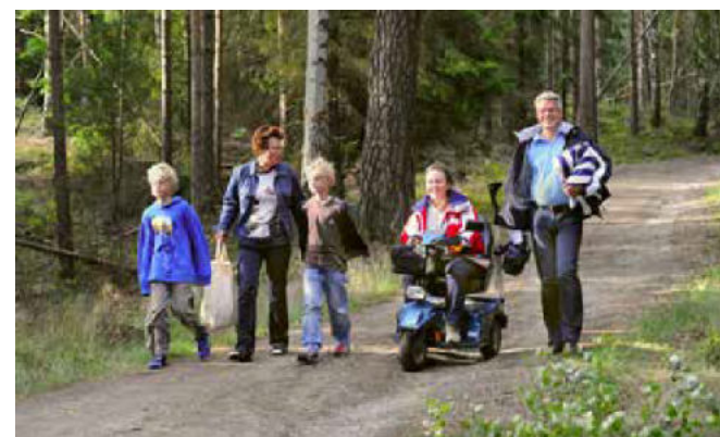
På promenad i skogen