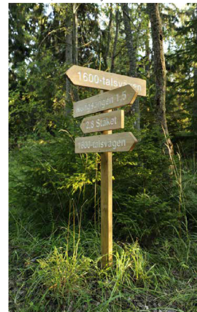
Hänvisningspilar vid Dalkarlsbacken

Förutom orange markering på träd och stolpe finns det ett antal pilar uppsatta. Det finns pilar med orange färg som berättar att leden ändrar riktning. Det finns även pilar med text och siffror som berättar hur lång en viss sträcka är. Längs leden finns 14 informationstavlor där du kan lära dig mer om natur, kultur och miljö.