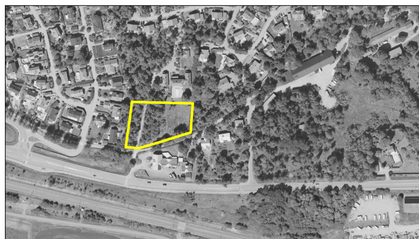
ORIENTERINGSKARTA (1:5000 A3)

g 1 Markreservat för gemensamhetsanläggning för väg. Kvartersmark