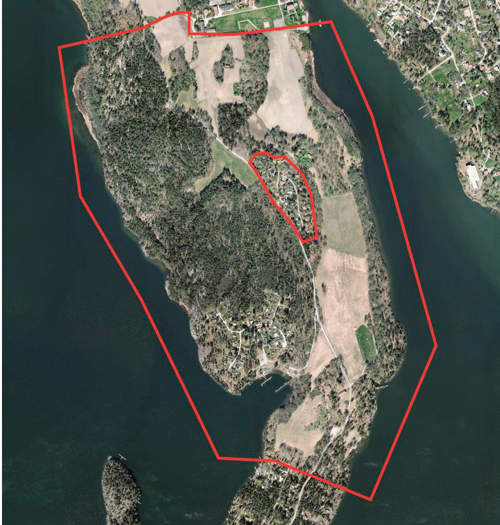
Flygfoto med planområdet markerat.

Planområdet i sin helhet är cirka 180 hektar stort och ligger i Bro på Ådöhalvön. Den del av planområdet som planändringarna berör och som detta dokument kommer att fokusera på är det röda mindre området markerat i mitten av planområdet på cirka 4,5 hektar. Området avgränsas i väster till Ådövägen och i norr, öster och söder till skogsmark.