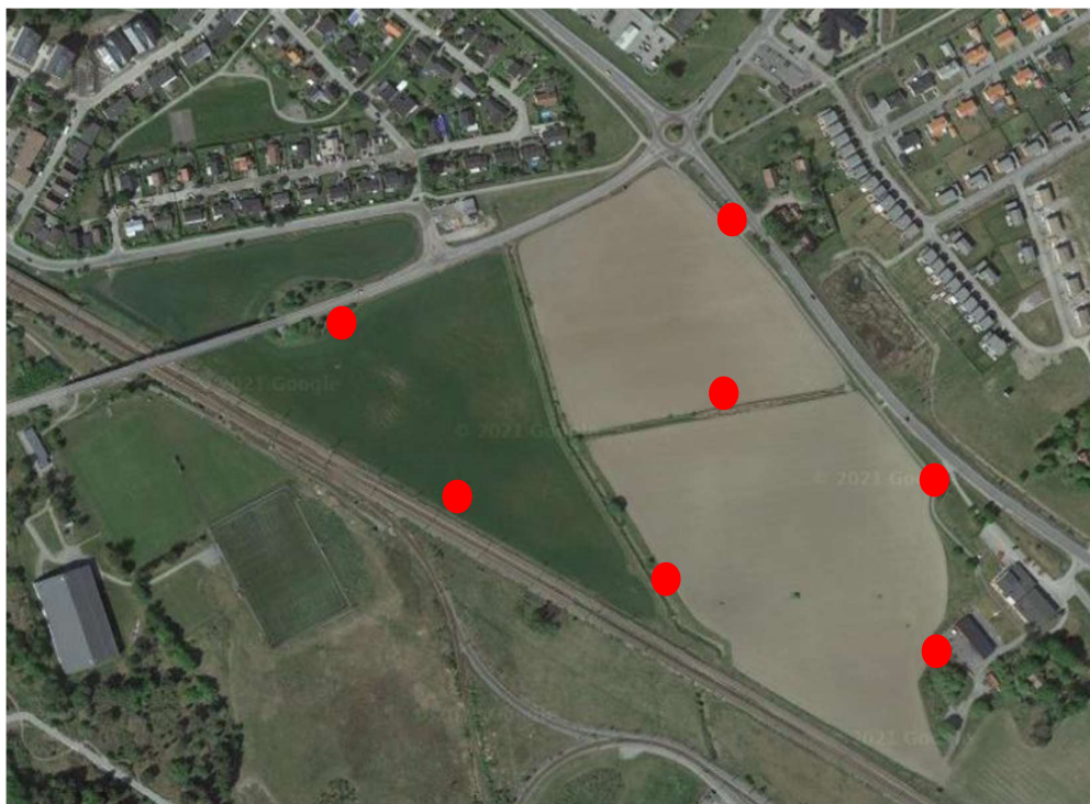
Figur 2 Grundvattenrör markerade med röda cirklar.

Ungefärlig placering av de 7 grundvattenrör som är relevanta för denna utredning framgår av figuren nedan, för exakt placering se MUR Geoteknik.