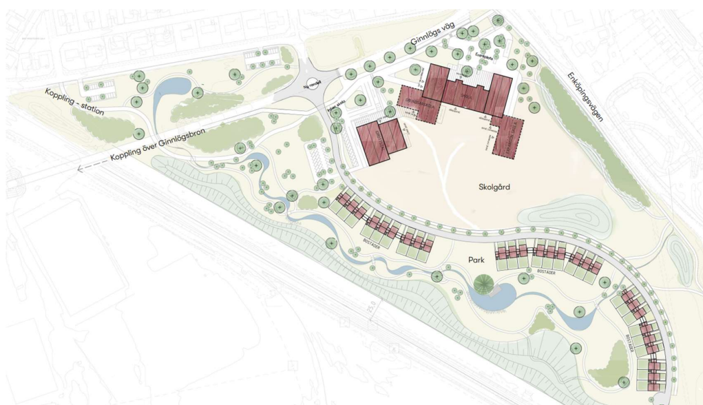
Figur 1 Situationsplan, daterad 2021-07-09

Nedan visas en preliminär layout över exploateringen på Kockbacka Gärde. Längs med Enköpingsvägen och befintlig järnväg planeras bullervallar enligt figur nedan. Dagvattendammar planeras längs med bullervallarna mot befintlig järnväg.