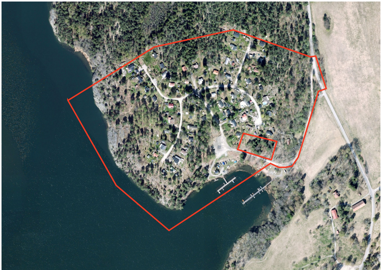
Flygfoto med planområdet markerat med röd linje.