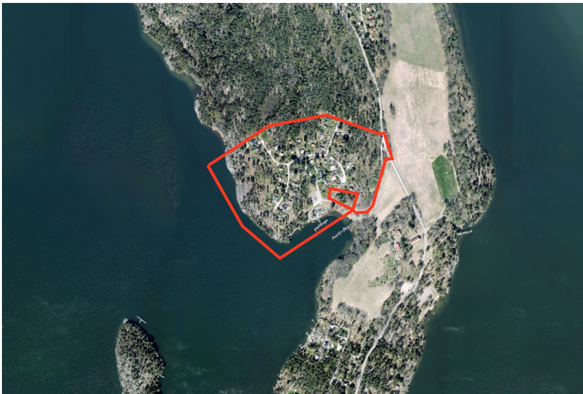
Översiktskarta med planområdet markerat.