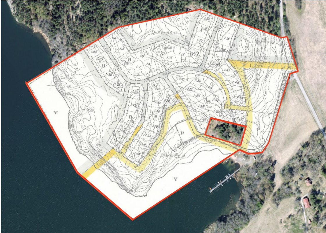
Gällande plan för området. Ett mindre område undantogs vid fastställandet, där gäller byggnadsplan 5601.

Förslaget till ändring gäller bara de bestämmelser som beskrivs i ett särskilt dokument, Planbestämmelser. Dessa bestämmelser ska läsas tillsammans med gällande plan 6302-F. De bestämmelser som ändrades i 8105 finns upptagna i det nya dokumentet med bestämmelser, dessa ersätts därmed. För att förslaget ska vara tydligt nog har alla planbestämmelser samlats i ett dokument, som ersätter de tidigare dokumenten med planbestämmelser.