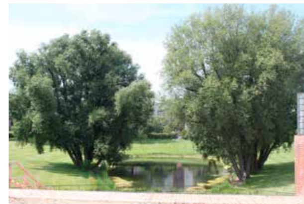
Hufeisensiedlung, Berlin (Bild: C F Möller, Arkitekt Bruno Taut) Värdigt, intimt och generöst stadsrum.