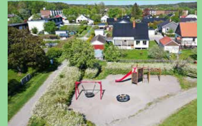
Mälarparken, Upplands-Bro Enkelt och öppet.

Skapa en palett av karakteristiska detaljer utifrån projektets förutsättningar. Formulera hur de bidrar till att tillföra kvalitet till platsen.