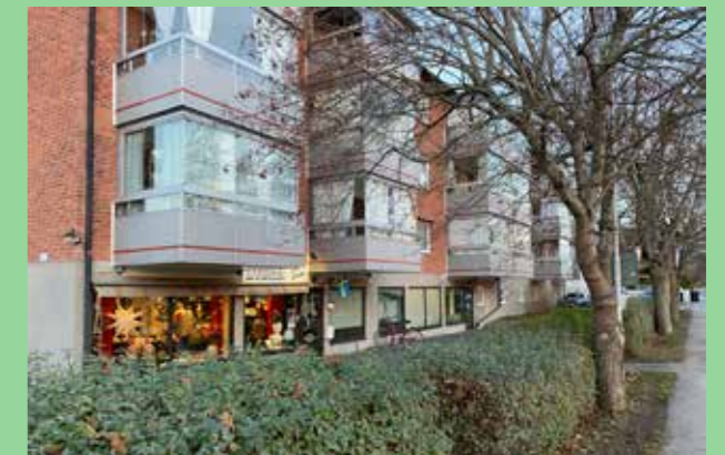
Bro, Upplands-Bro