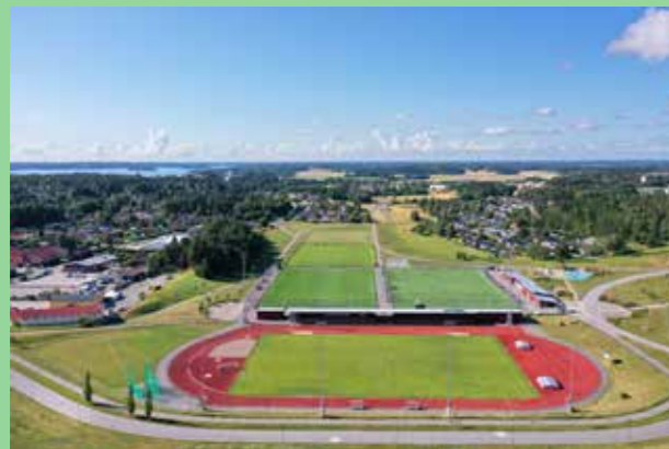
Kungsängens idrottsplats. Väl placerad, ytkrävande verksamhet.