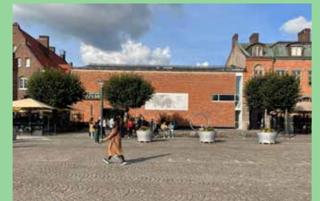
Lunds konsthall 1957 (Bild: C F Møller. Arkitekt Klas Anshelm) Enhetlighet i material. Stillsam, varierad färgskala.