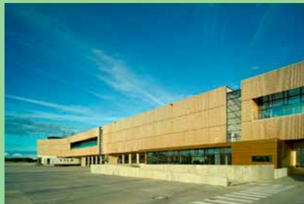
Logistikcenter, Hederlev Danmark Väl valda material i karaktärsstark byggnad.

Lägg vikt vid det som inte är det storskaliga trafiklandskapet. Finns det möjlighet att röra sig här till fots? Hur förhåller sig platsen till omgivande områden? Ta vara på de möjligheter som finns att knyta platser till varandra. Differentiera. De stora trafikflödena behöver sin yta. Skapa skyddade intimare miljöer där man kan röra sig till fots. Skapa gatusektioner som rymmer alla nödvändiga funktioner.