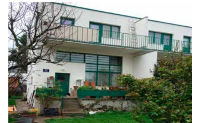
Werkbundsiedlung, Wien, Österrike. 1930. (Bild: C F Möller, Arkitekt Adolf Loos) Välproportionerad förgårdsmark. Enkla, omsorgsfulla byggnader.