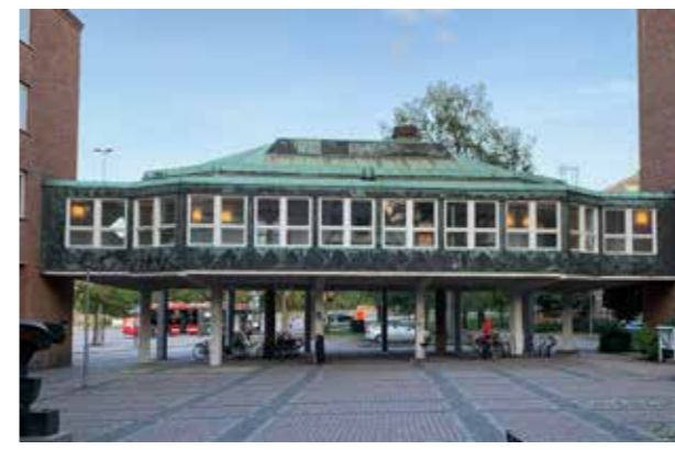
Socialstyrelsen, Västerbroplan (Bild: C F Möller. Arkitekt Kjell Ödeen) Lekfulla byggnader.