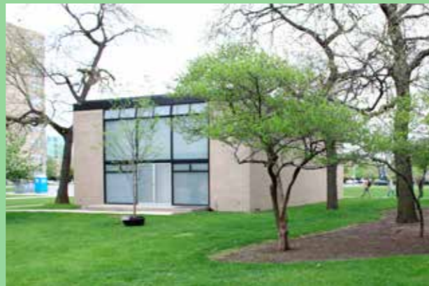
Illinois Institute of Technology, Chicago (Arkitekt Mies van der Rohe) Enkel volym med tydlig proportionering.