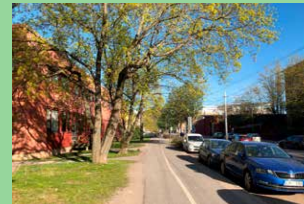
Lövholmens industriområde. Väl valda material i karaktärsstark byggnad. Kontors-, verkstads- och industribebyggelse kompletterar varandra och skapar en rik och varierad miljö.

fasader förhåller sig till det omgivande landskapet och trafikmiljöer. Gestalta byggnader på ett sätt som är gripbart på olika avstånd.