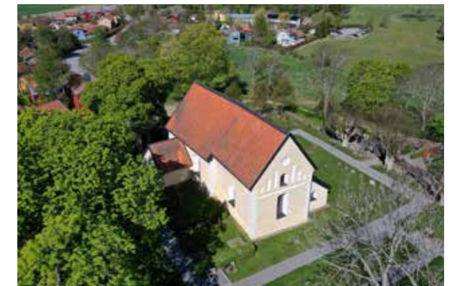
Häbo-Tibble kyrka Enkel byggnadsvolym med stark materialverkan.

Den som vill bygga i Upplands-Bro ska med Gestaltningsskildningen i hand enkelt kunna skapa sig en bild av vad det krävs för nivå på gestaltning för det projekt man tänkt sig. Gestaltningsskildningen förmedlar bilden av vad Upplands-Bro är och hur det ska förvaltas och utvecklas.