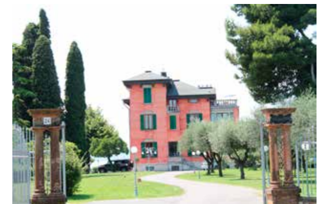
Italien (Bild: C F Möller) Enkel och omsorgsfull detaljering i samspel med ljus och grönska.