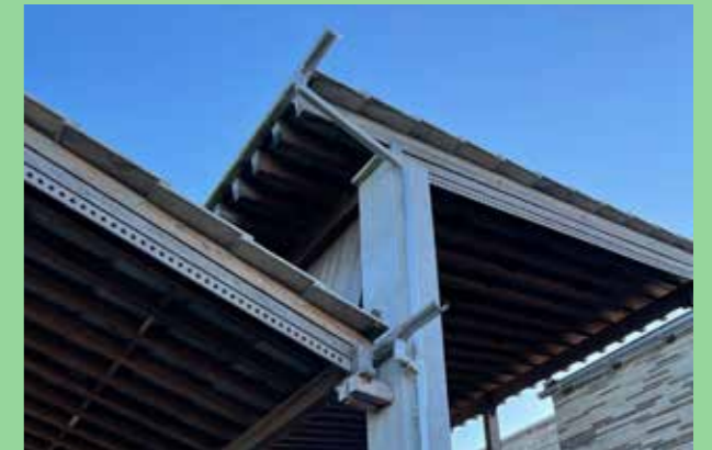
Sankt Knuts Kapell, Östra kyrkogården, Malmö (Bild: C F Möller, Arkitekt Sigurd Lewerentz)

Engagemang är grunden för vacker och god arkitektur. Där många människor rör sig ska särskilt stor omsorg läggas vid detaljer. Engagemang i gestaltningen lämnar spår som visar att någon tänkt. Enkelt eller komplext utifrån uppgiftens och platsens förutsättningar.