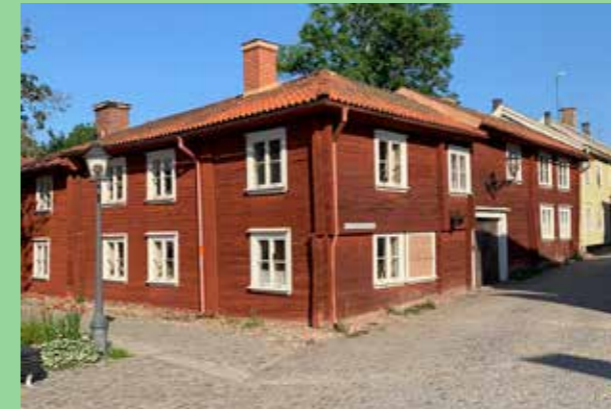
Eksjö Jönköping Utemiljöer som bjuder in till olika användning.

Identifiera de skalor och måttförhållanden som finns på platsen. Ligger platsen centralt i tätorten eller i övergången mot natur och glesare bebyggelse?