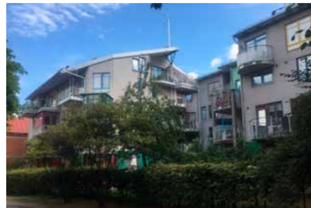
Malmö. (Bild: C F Möller) Grönska och varierande former.