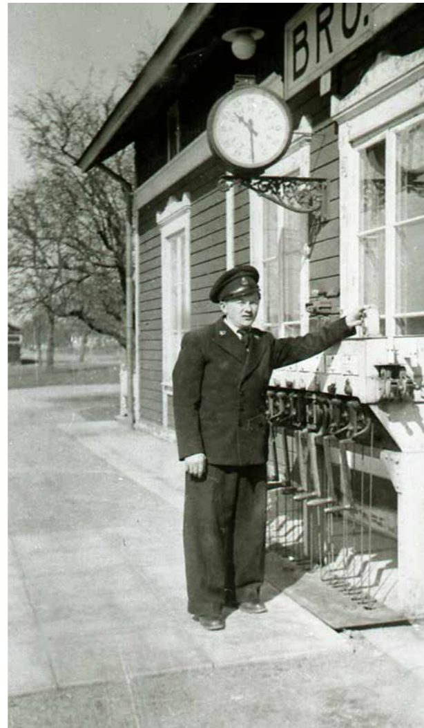
Bro stationsområde.

Kommunen har funnit att detta är en god tid att reflektera över vad man vill med framtidens fysiska miljö. Hur vill vi att det framtida Upplands-Bro ska se ut? Ett vackert Upplands-Bro med den diversitet mellan tätortsmiljöer och landsbygd som skapar kommunens speciella karaktär. Vad är detta mer konkret? Som verktyg för att åstadkomma detta har man beslutat att ta fram denna Gestaltningpolicy.