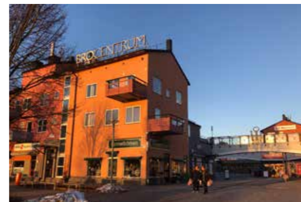
Bro torg (Bild: C F Möller) Variation i kulör och skala.