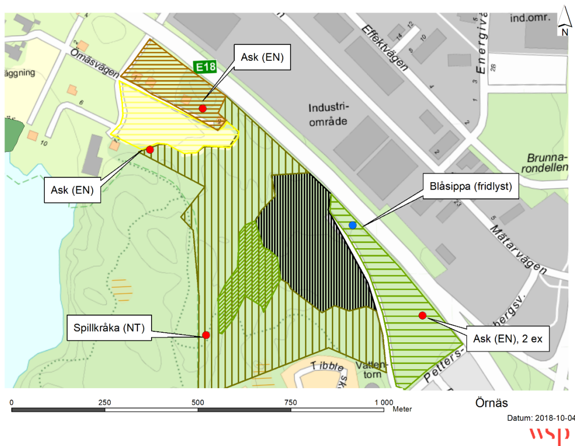
Figur 1. Geografisk lokaliseringskartor av rödlistade arter (röda punkter) och fridlysta art (blå punkt) i utredningsområdet (streckad yta med områdesindelning, se huvudrapport).