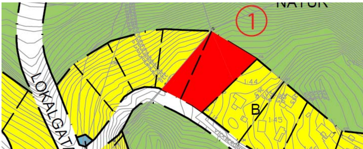
Bild 1: Illustration över område 1 där förordnandet enligt 113 § BL föreslås upphävas.

Område 2 är i byggnadsplanen för Ålsta planlagt som Allmän plats, gata. Marken har dock aldrig lösts in och utgör idag ianspråktagen kvartersmark och hör till fastigheterna Kungsängens-Ålsta 1:21, 1:22 och 1:23. Markanvändningen i samrådsförslaget till detaljplanen för Ålsta-Aspvik-Ensta är kvartersmark för bostadsändamål.