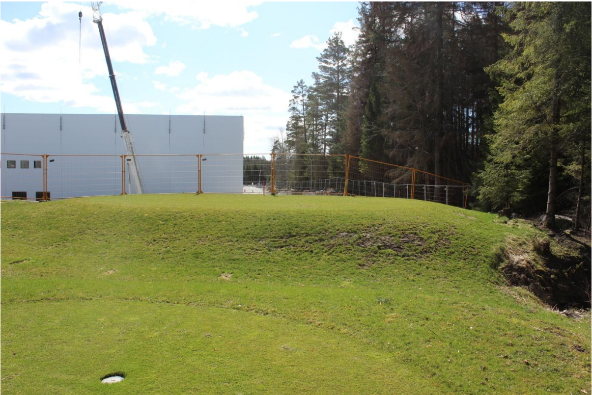
Figur 6. På platsen för damvallen L2014:6052 finns idag en utslagsplats. Foto från N.