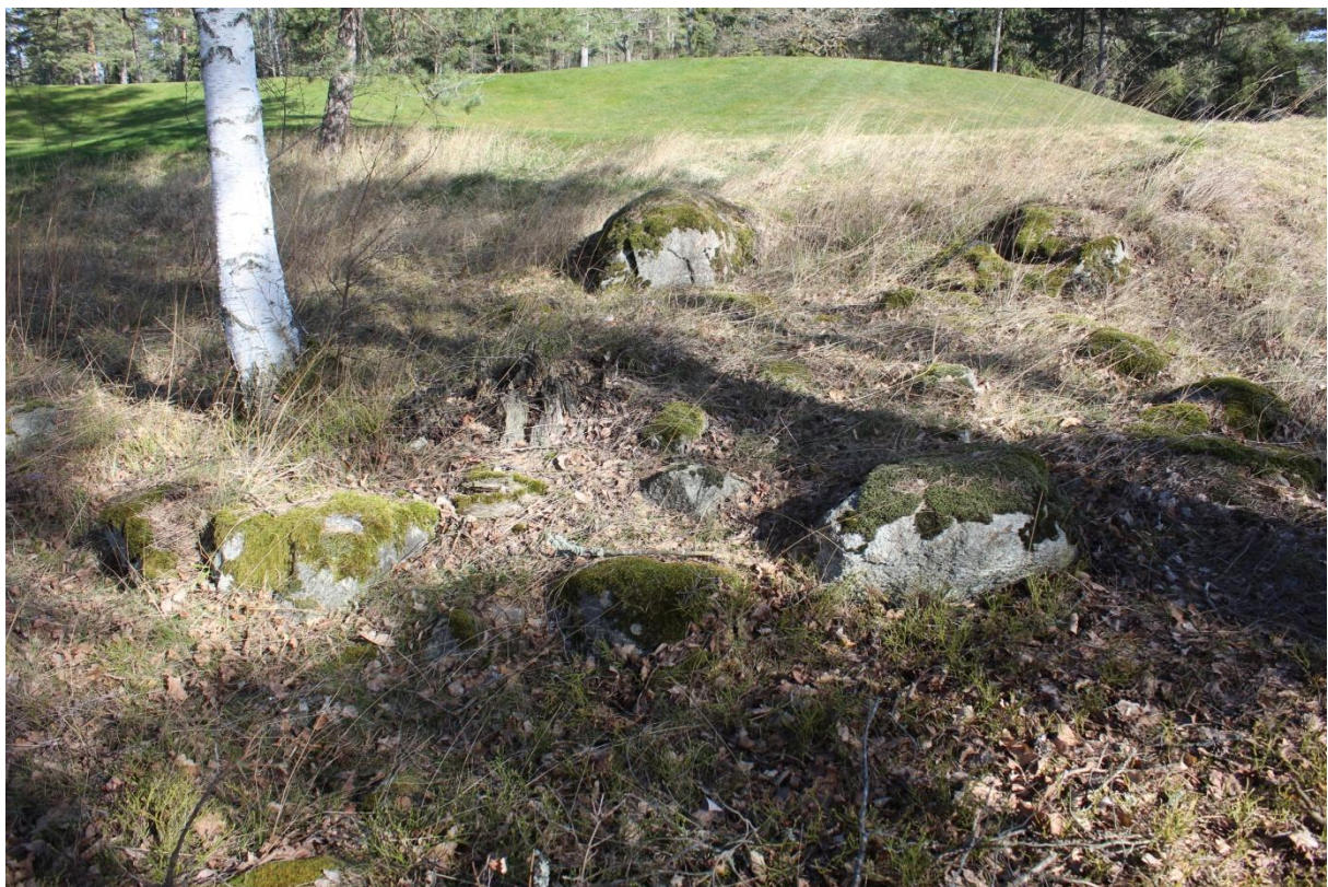
Figur 2. Stensättningen objekt 3. Foto från väster.