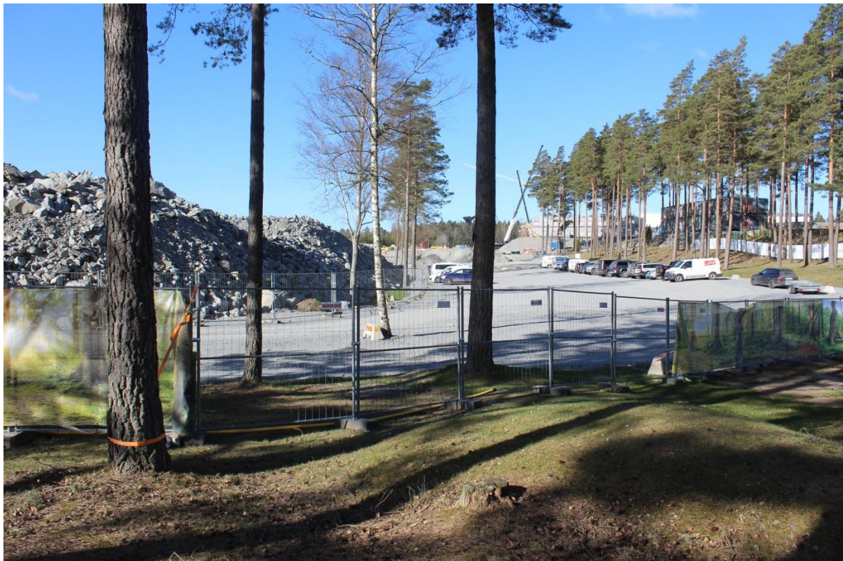
Figur 1. Utredningsområdets södra del har delvis redan börjat att bebyggas. Foto från NÖ.