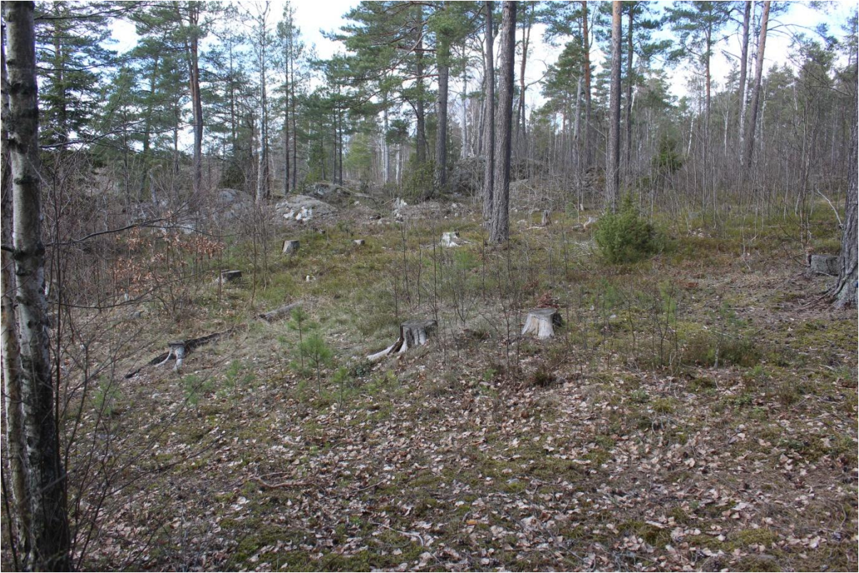
Figur 5. Boplatsläget objekt 5. Foto från sydöst.