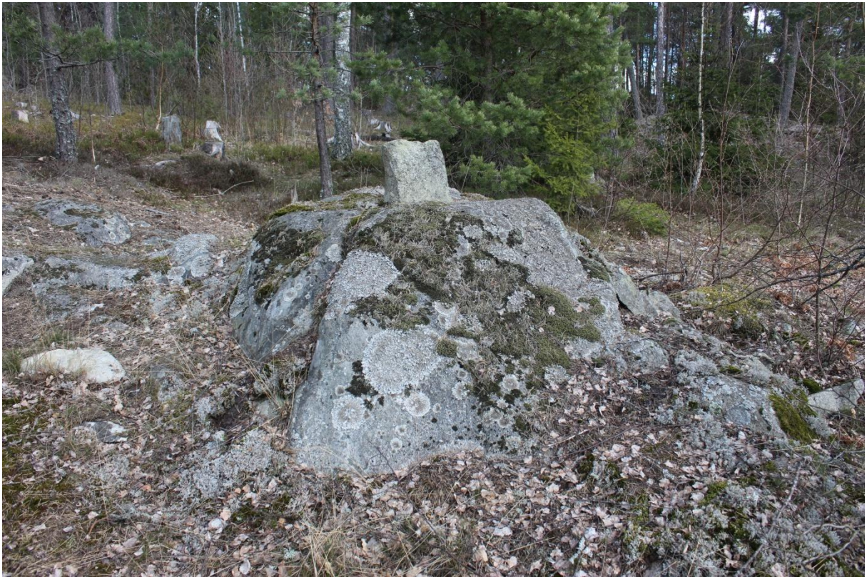
Figur 3. Gränsmärket objekt 6. Foto från sydväst.