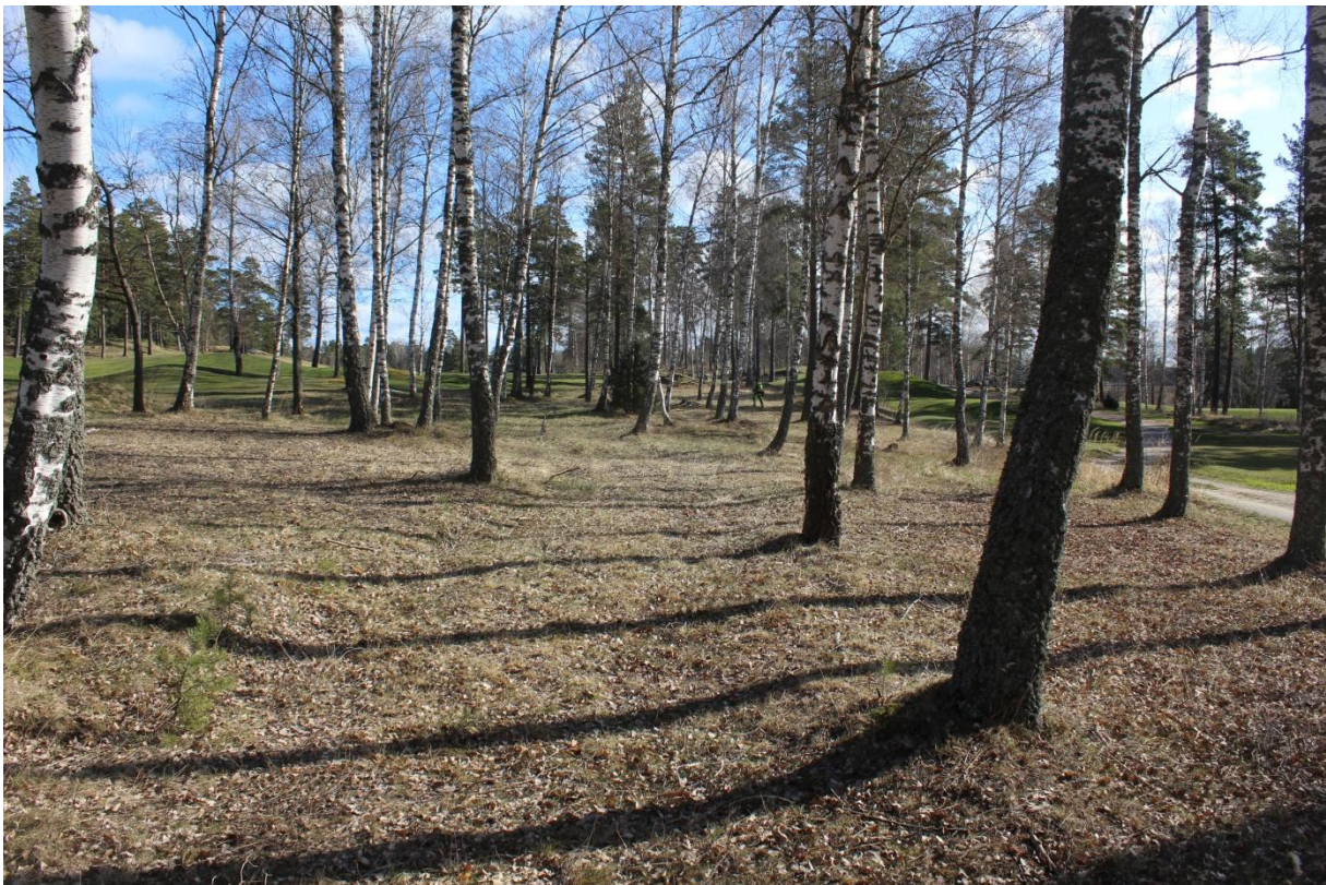
Figur 4. Boplatsläget objekt 2. Foto från sydväst.