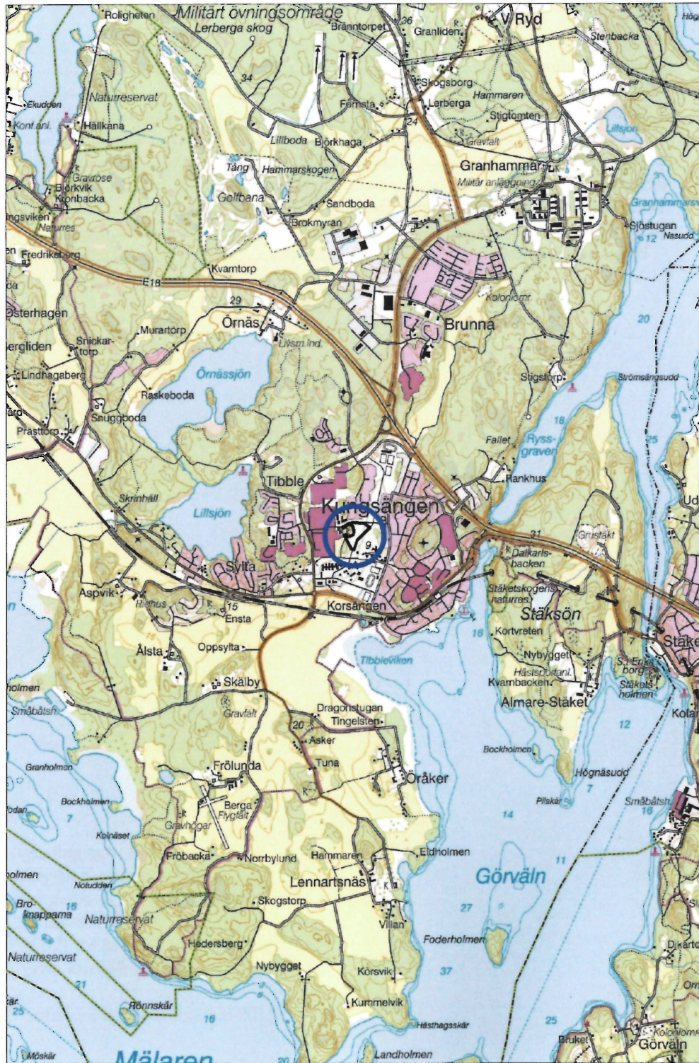
Figur 1. Utredningsområdet markerat med en svart linje och en blå ring. Utsnitt ur digitala terrängkartan. Skala 1:50 000.