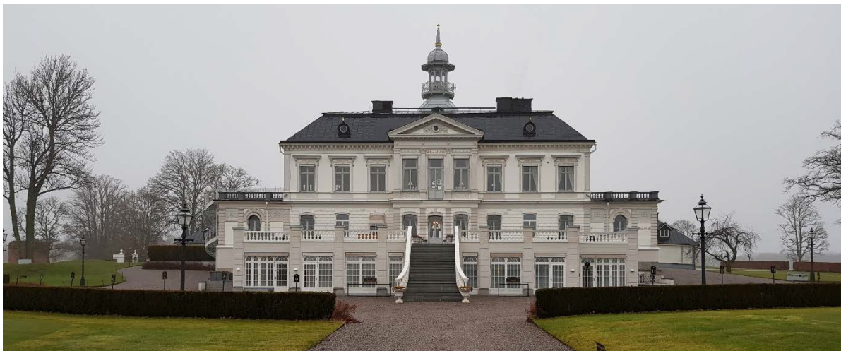
Bro Hof Slott från söder

Förutom för golfbanan föreslås några mindre justeringar av planen runt Slottsområdet. I en del, vid de gamla ekonomibyggnaderna, vill man ta bort prickmark (mark som ej får bebyggas) i syfte att ge möjlighet att uppföra servicebyggnader – bl a en redan anlagd spolplatta för golfbanans arbetsmaskiner (temporärt bygglov har beviljats för denna i avvaktan på planändring). Den sammanlagda bygg rätten begränsas här till 1000 m 2 , med en maximal byggnadsarea om 200 m 2 för varje enskild byggnad. Vidare så stärks skyddet av den gamla ladugården genom en bestämmelse om rivningsförbud.