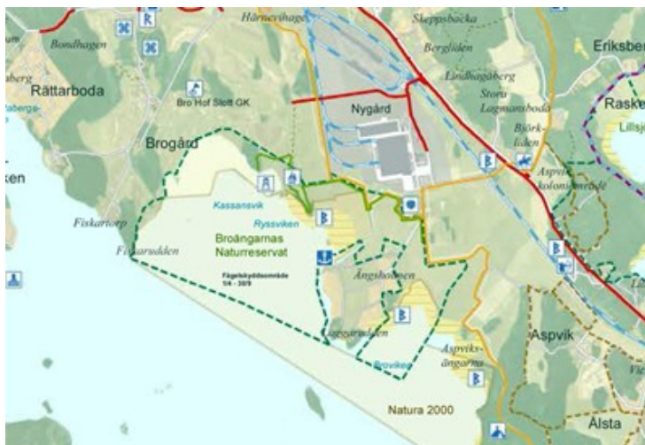
Bro Hof Slott GK och Broängarnas naturreservat

Skötselplanen till naturreservatsbeslutet samt exploateringsavtalet reglerar också iståndsättandet av naturvärdena inom reservatet. Planen innehåller också detaljerade beskrivningar av hur golfbanan ska anpassas till den kulturhistoriska miljön kring herrgården samt hur ett stort antal av de förfallna kulturbyggnaderna och kulturmiljön skulle rustas och skyddas.