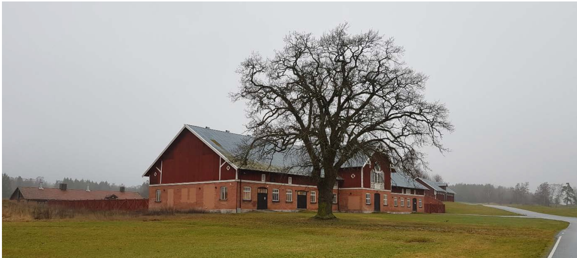
Gamla ladugården som nu används som driftcenter för golfbanan

För området gäller detaljplan för Brogård nr 0315.