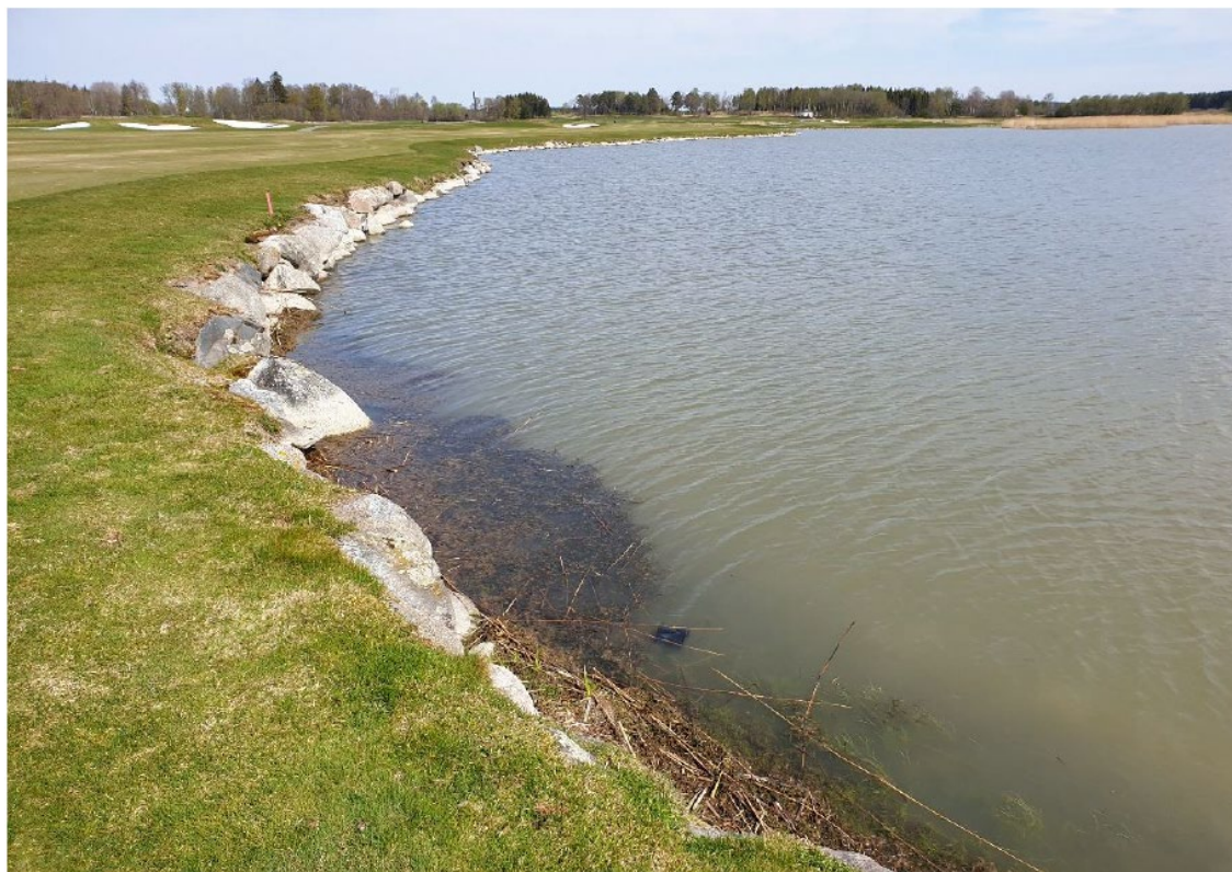
Golfhål 15. Nära strandskoningen finns grumligt vatten ett par meter ut från strandlinjen.

Länsstyrelsen har påpekat att det pågår en kontinuerlig grumling i Broviken. Bakgrunden till grumlingen är att sjöbotten utanför strandskoningen utgjordes av åkermark fram till år 2000, då skyddsvallen, som anlades på 1940-talet, brast och cirka 40 hektar åkermark vattendränktes. Strandskoningen behövs och måste kunna underhållas löpande, då marken annars blir blottad för vattnets rörelser.