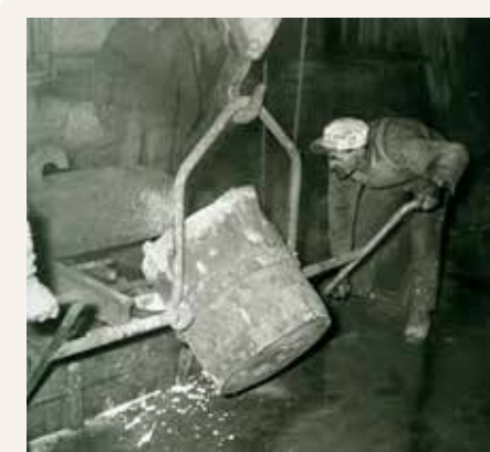
Fotografiet är taget 1930 på familjeföretaget Ryds gjuteri, som låg vid en strand i närheten av Kungsängen i Upplands-Bro från 1903 till 1966.

I gjuteriet tillverkades delar till större maskiner, till exempel tvättmaskiner och pumpar.