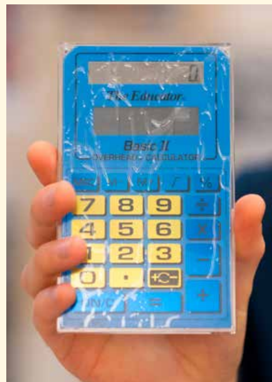
The educator, en miniräknare som kunde visas på vita duken i klassrummet genom att lägga den på en overheadapparat. Undrar du vad en overhead är? Googla!

Tusentals har tagit sin studentexamen på Upplands-Brogymnasiet sedan starten 1983. Kanske att du är en av dem?