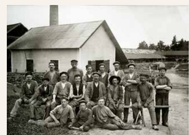
Männen och pojkarna som arbetar på Brogårds tegelbruk i Upplands Bro har ställt upp sig till fotografering. När affärerna gick som bäst på 1940-talet tillverkades där ca fem miljoner tegelstenar om året, men efter andra världskriget blev betong ett allt vanligare byggmaterial. Det gick att gjuta i större stycken, vilket gjorde att bygget gick snabbare.

Annons ur tidningen Skogs- och Lantarbetet år 1925. Under 1900-talets första årtionden så följde demonstrationer och strejker på varandra. Det var en orolig tid i Sveriges historia. Arbetare i städerna och på landsbygden krävde ökade rättigheter och högre löner. I Kungsängen rustade statarna för strejk för att få bättre arbetsvillkor.