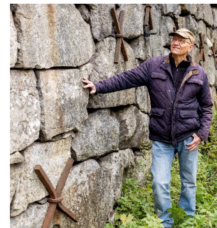
Stödmuren tillhör 1800-talsvägen genom Upplands-Bro. I Stäketskogen finns flera spår av vägen.

Först 1967, i samband med att vi gick över till högertrafik, invigdes den första motorvägsdelen av dagens E18.