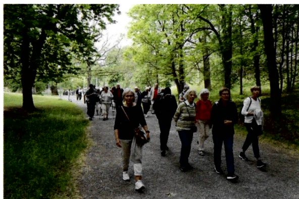
Glada äventyrare på väg mot Rosendals trädgård juni 2019.

Till hösten blir det fem äventyrsresor. Samling kl. 09.45 på Kungsängens station övre planet innanför biljettspärrarna, med undantag för utflykten till Medelhavsmuséet.